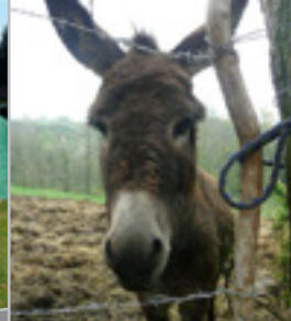
Respect des animaux