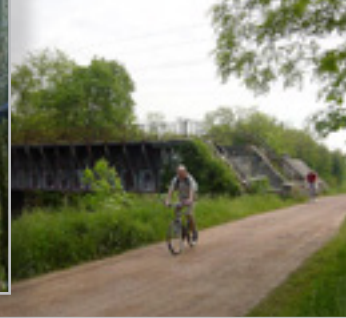
Développement des loisirs