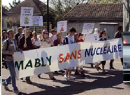
Projet d'installation concerté