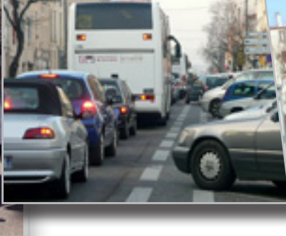
Organiser les déplacements urbains