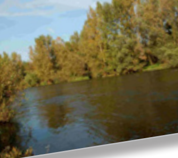
Un fleuve libre