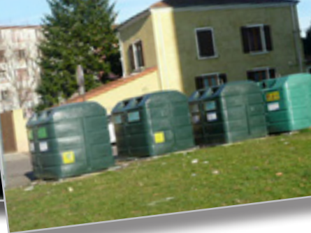
Gestion des déchets en porte à porte